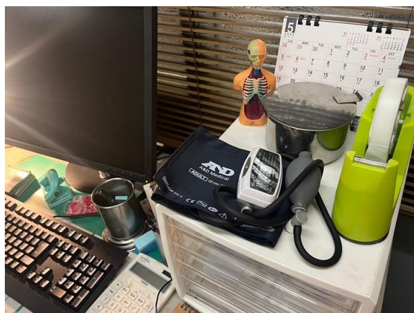
デジタル血圧計「UA-704CR（スワンミニ）」を ご採用いただいているセットの一部

https://www.aandd.co.jp/products/medical/equipment/me-pulse_oximeter/tm1121/