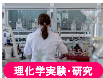
理化学実験・研究