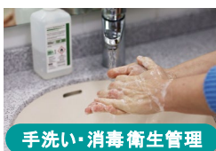
手洗い・消毒衛生管理