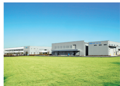
校正が行なわれる開発・技術センター