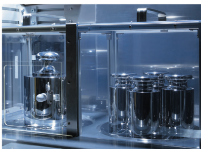
JCSSを始めとする 各種の技術要求に対応する設備